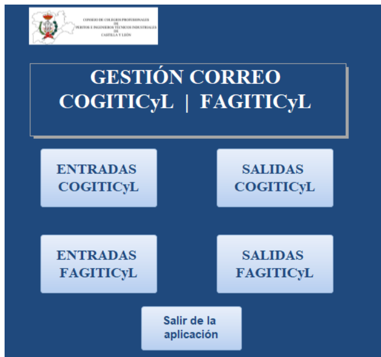
Aplicación de registro de correspondencia COGITICyL